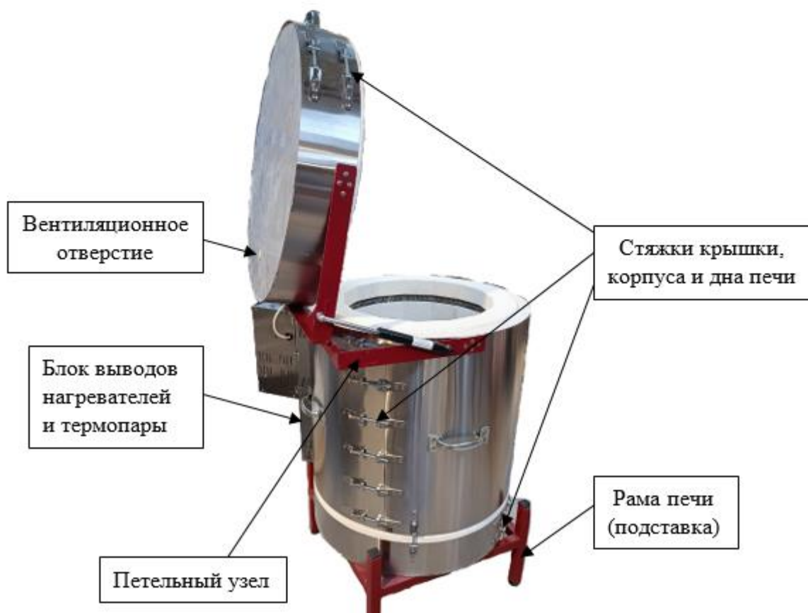
Рисунок 1. Общий вид печи (Реальный вид печи может отличаться от представленного)